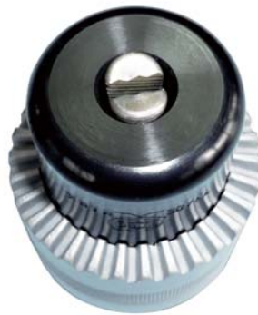
TF型 (平材用) 2本爪