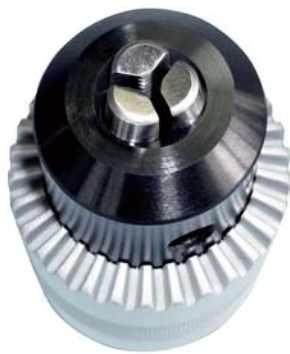
TR型 (丸材用) 3本爪