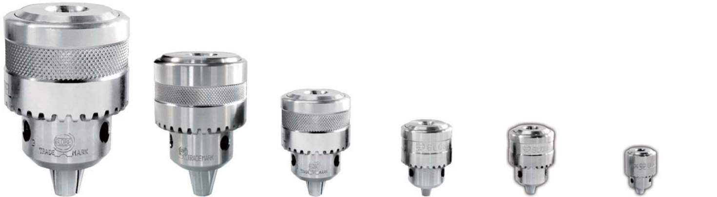
SUS 19 mm JT4 SUS 13 mm JT6 SUS 10 mm JT2S SUS J 8 mm JT1 SUS 6.5 mm JT1 SUS 4 mm JT0 (ネジ 1/2-2.0 UNFあり) (ネジ 1/2-2.0 UNFあり) (ネジ 3/8-2.4 UNFあり) (ネジ 3/8-2.4 UNFあり) (ネジ 3/8-2.4 UNFあり) (6.5 EL同サイズ)