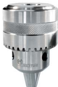
SUS 13 mm JT6 (ネジ 1/2-20 UNF あり)