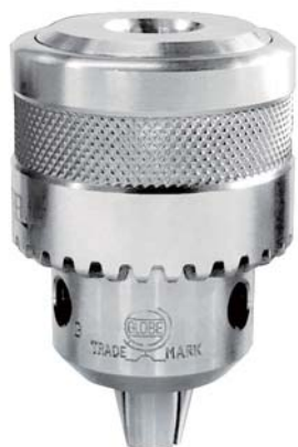
SUS 19 mm JT4