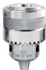
SUS 10 mm JT2S (ネジ 1/2-20 UNF あり)